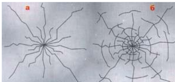
Рис.4. Типы растрескиваний льда под нагрузкой: а – радиальные трещины, не ведущие к провалу груза; б – радиальные трещины, сопровождаемые концентрическими разрушениями, ведут к быстрому провалу груза.

Об упругих свойствах льда говорят следующие количественные данные. Если рассматривать прозрачный, наиболее прочный лед, то при центральном прогибе его в 5 см трещин на нем не образуется; прогиб в 9 см ведет к усиленному образованию трещин, прогиб в 12 см вызывает сквозное растрескивание, при 15 см лед проваливается. Трещины под действием нагрузок возникают двух типов: радиальные (рис.4-а) и концентрические (рис.4-б).